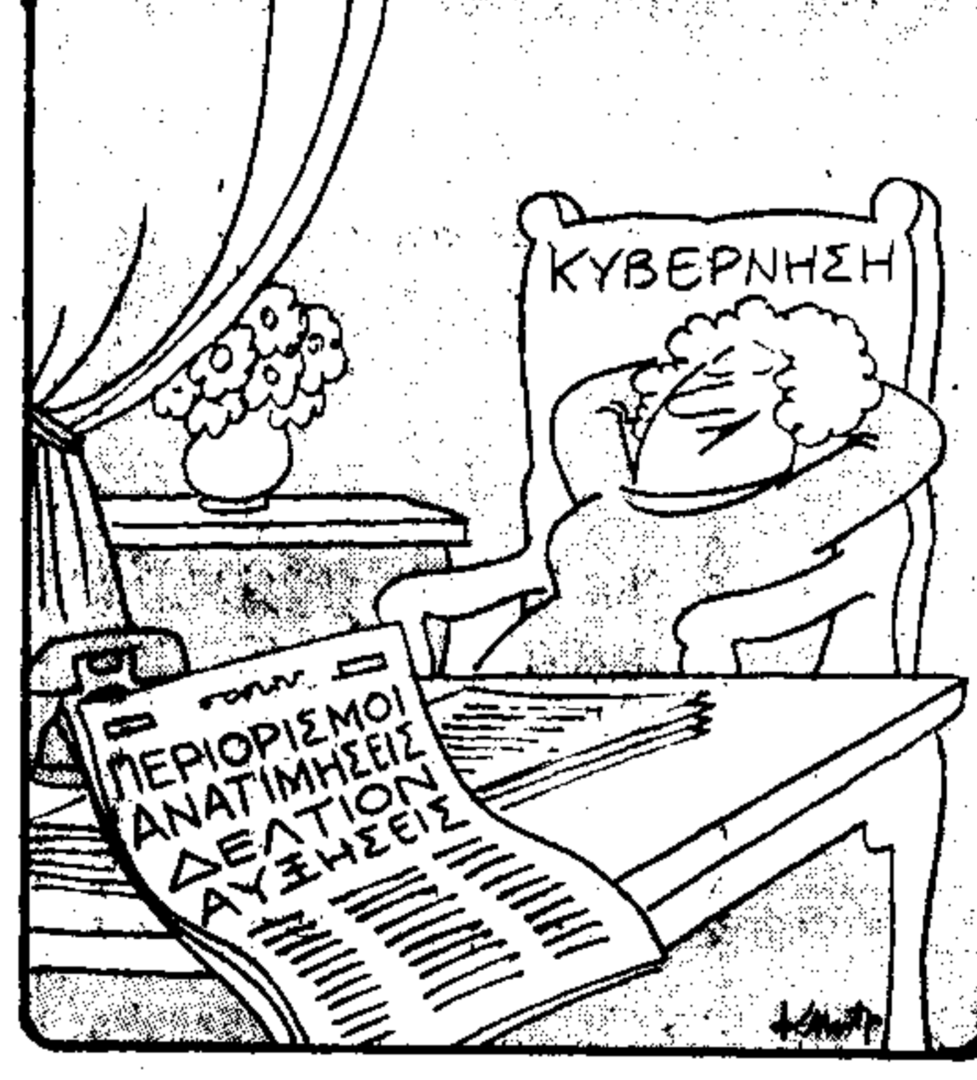
— Τί άλλαξε; Τά πάντα!..