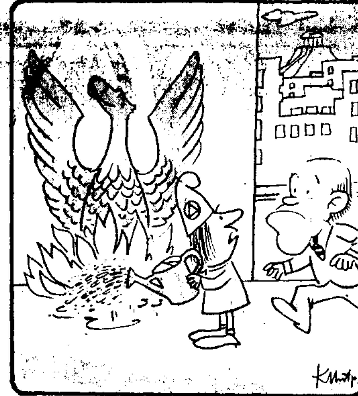
— Οικονομία στα κοσμάκια δεν είπατε;